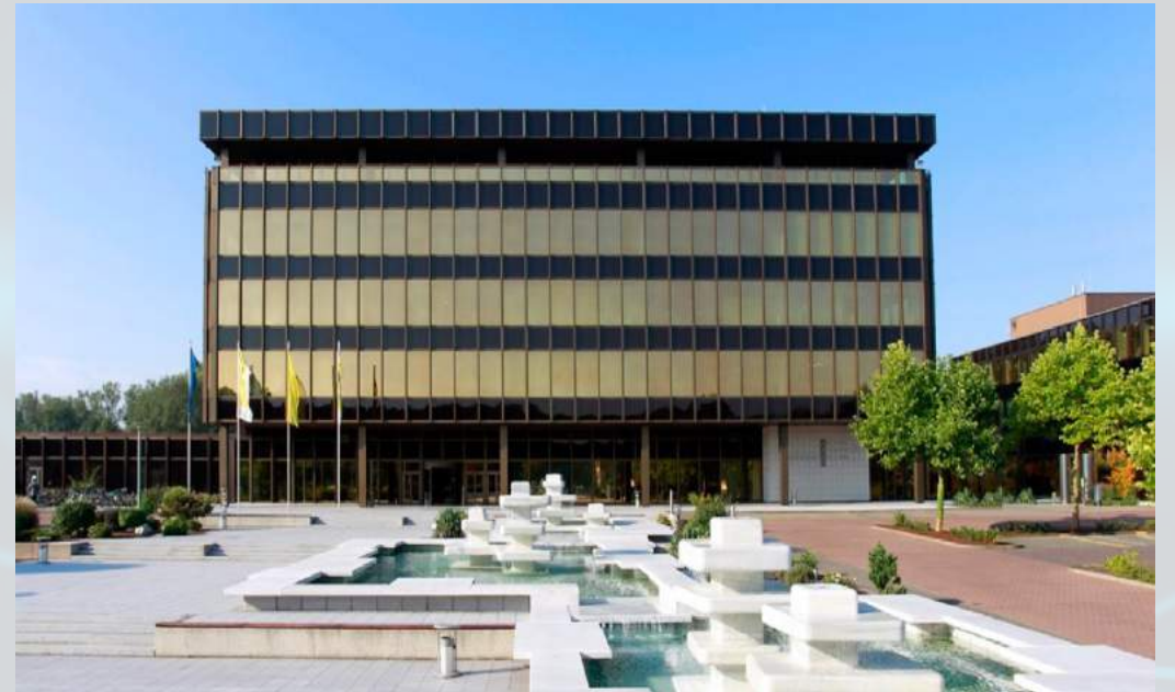
Heinz Nixdorf Museumsforum, Paderborn

Der TdSE 2022 bietet Ihnen als Sponsor unterschiedliche Möglichkeiten: Profitieren Sie von dem individuellen Austausch vor Ort, präsentieren Sie Ihre Ausstellungstände und bereichern Sie unser Programm mit abwechslungsreichen Vorträgen. Weitere Leistungen der jeweiligen Sponsorenpakete finden Sie auf den folgenden Seiten.